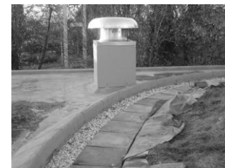
nieuwe ventilatoren en tegelpad op het dak

Wij zijn bijzonder verheugd over het feit dat het onze parochie is gelukt om dit groot onderhoud voor een aanzienlijk deel zelf te financieren. Door extra financiële ondersteuning werd het mogelijk om binnen de begroting te blijven. Daarom via deze weg een welgemeend dankjewel aan: