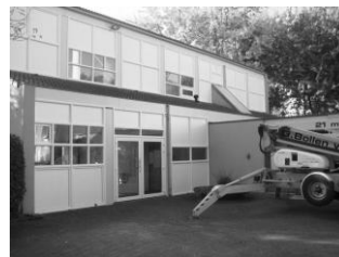
Nieuwe kunststof kozijnen

Op onze website www.sintandreas.nl vindt u onder het kopje 'berichten groot onderhoud' uitgebreide informatie en foto's, zodat u een goede indruk krijgt van de uitgevoerde werkzaamheden. U treft deze informatie ook aan op het speciale prikbord in de koffiekamer.