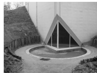
herstel buitenvijver in oorspronkelijke staat